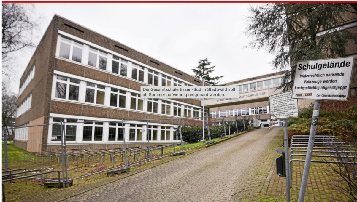
Die Gesamtschule Essen-Süd in Stadtwald soll ab Sommer aufwendig umgebaut werden.